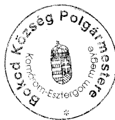
Szöllősi Miklós polgármester